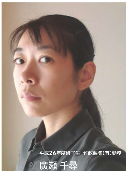
平成26年度修了生 竹政製陶(有)勤務