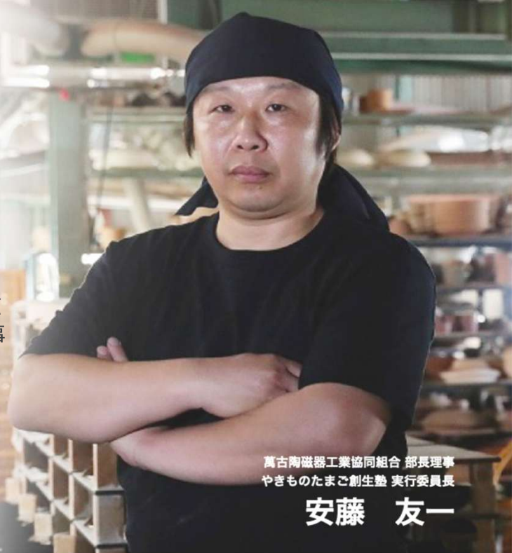
萬古陶磁器工業協同組合 部長理事 やきものたまご創生塾 実行委員長

やきものたまご創生塾は、一人ひとりの能力を最大限に伸ばし、業界に貢献できる人材を育てます。