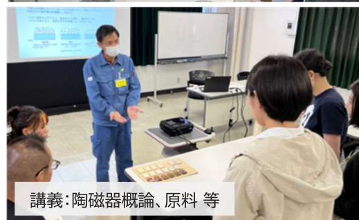
講義：陶磁器概論、原料等